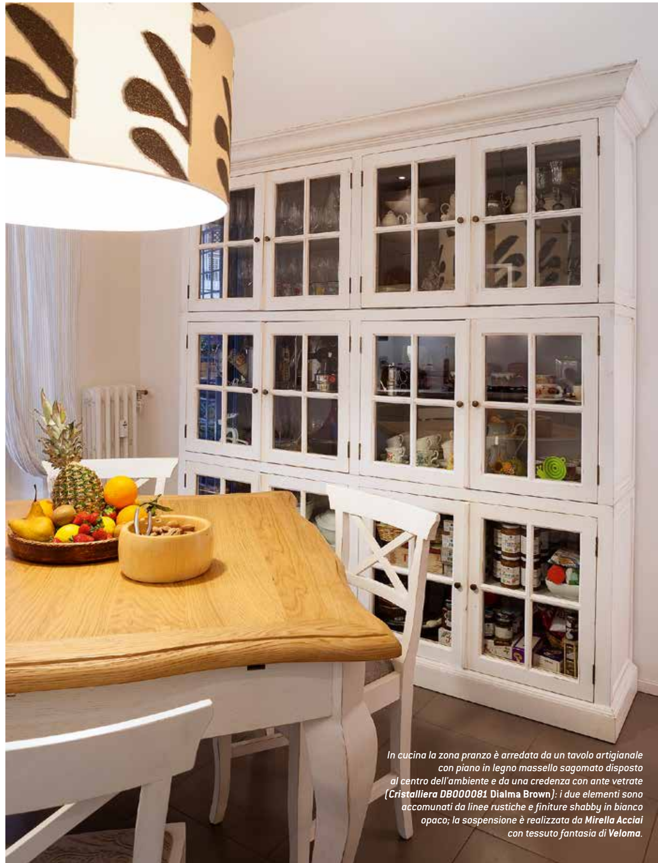
In cucina la zona pranzo è arredata da un tavolo artigianale con piano in legno massello sagomato disposto al centro dell'ambiente e da una credenza con ante vetrate (Cristalliera DB000081 Dialma Brown): i due elementi sono accomunati da linee rustiche e finiture shabby in bianco opaco; la sospensione è realizzata da Mirella Acciai con tessuto fantasia di Veloma.

Nelle rinnovata distribuzione, la cucina occupa ora l'ampio ambiente all'estremità dell'abitazione, dove una portafinestra dà accesso diretto al terrazzo. La zona operativa è tutta concentrata in linea su un'unica parete.